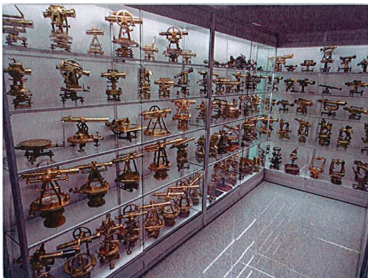
Vedere parțială a colecției de aparate topografice.