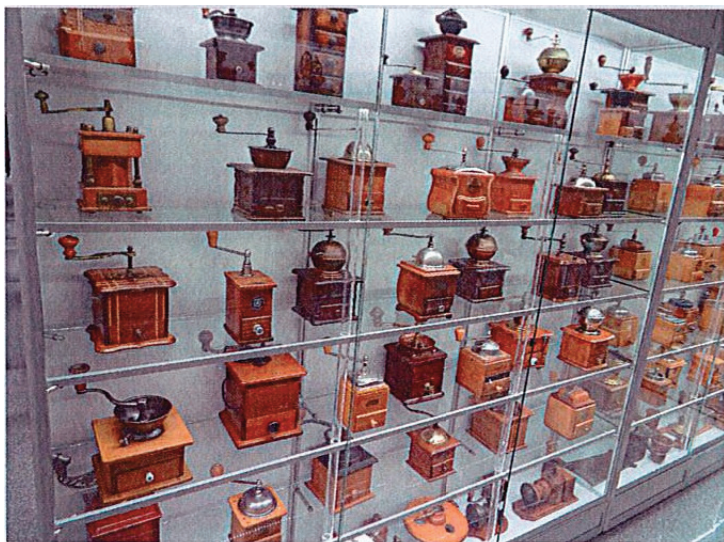
Vedere parțială a colecției de râșnițe de cafea.