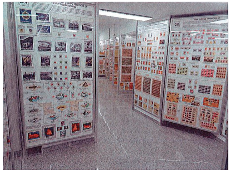
Vedere generală a colecției filatelice din România.

O excelentă publicație de 240 de pagini, în întregime color, din care a fost realizată deja a doua ediție în 2022, prezintă pentru fiecare dintre ele un rezumat grafic al fiecărei expoziții.