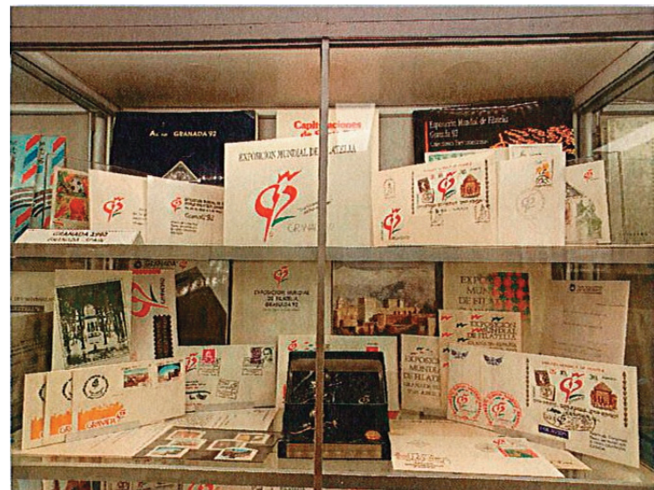
Material referitor la Expoziția Mondială de Filatelie 'Granada 92'.