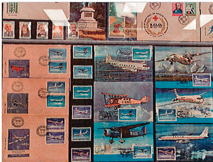
Detaliu al colecției filatelice din România.

În concluzie, un muzeu unic și extraordinar, indispensabil de vizitat dacă călătoriți în orașul fermecător București.