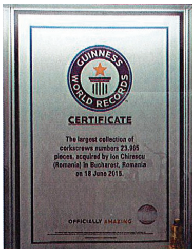
World Record Guinness pentru colecția de tirbușoane.

Acolo am putut admira o parte din colecțiile sale de tirbușoane (deținând Recordul Mondial Guinness în 2015, cu 23.965 de piese și în prezent cu aproximativ 30.000 de piese, după ce a achiziționat o parte din colecția familiei Vivanco din Briones, La Rioja), fiare de călcat (deținând Recordul Mondial Guinness în 2016, cu 30.071 de piese), aparate foto (aproximativ 4.000 de piese), aparate topografice, mașini de scris, mașini de