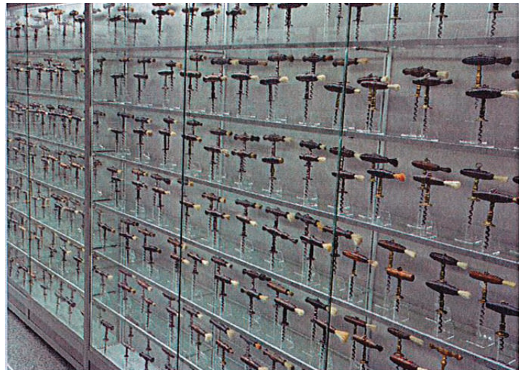
Vedere parțială a colecției de tirbușoane.